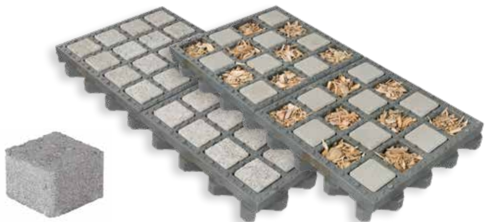
TTE® Pflasterstein GRIP

Zum Befüllen von 1 m 2 TTE® benötigt man 100 TTE® Pflasterstein GRIP Steine.