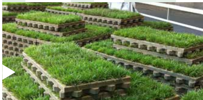
FIX & FERTIG ANGELIEFERT

Die Sofortlösung für begrünte Pkw-Parkplätze